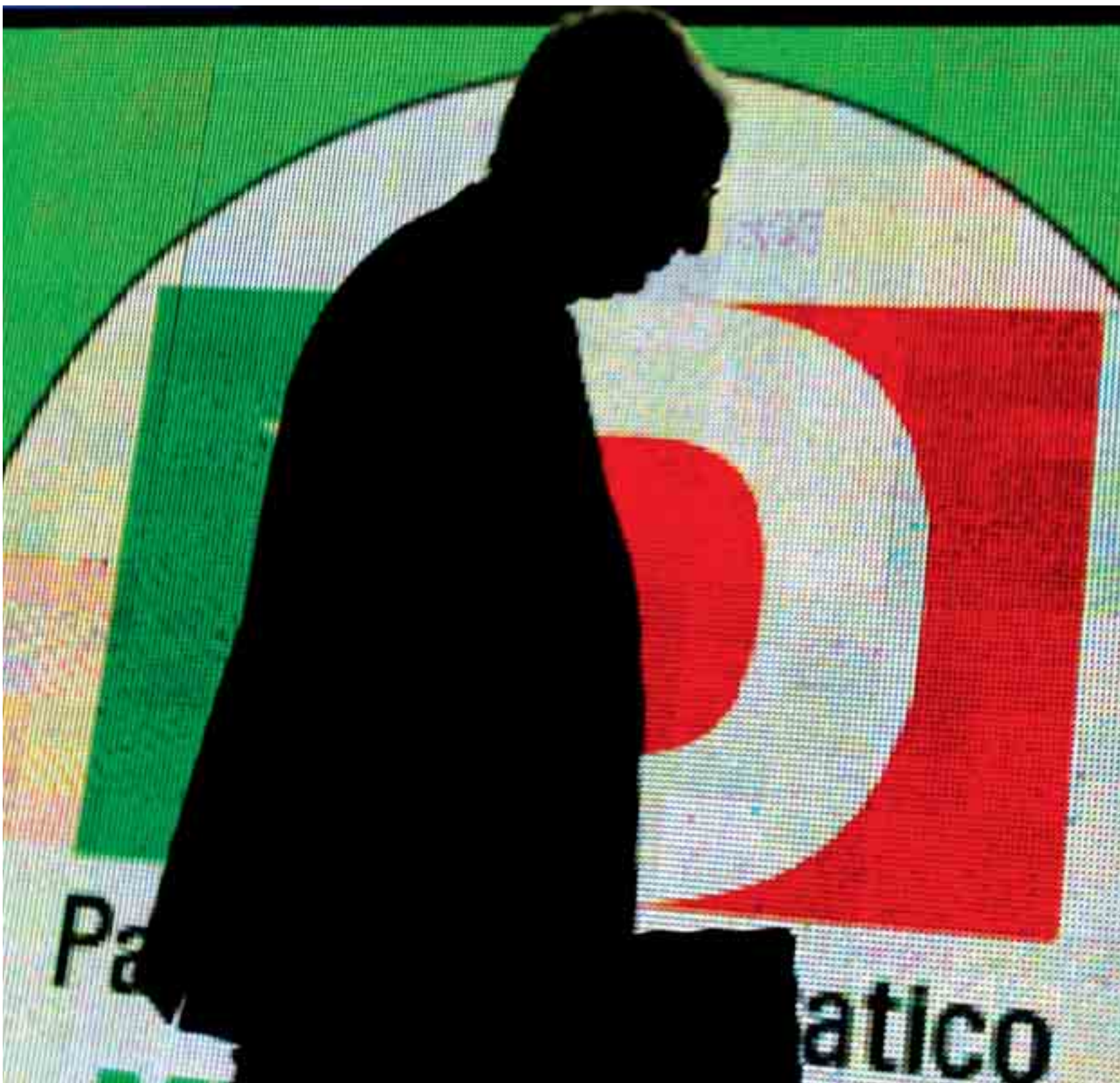
> Walter Veltroni alla convention del Partito Democratico