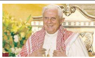
Papa Benedetto XVI

Da lunedì Ratzinger in Israele Il Papa ad Amman "Sì al dialogo con ebrei e Islam"