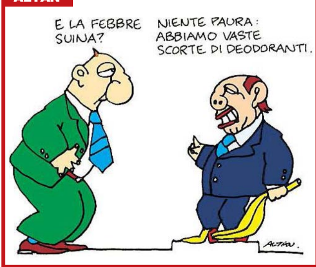
DUSI, REGGIO E VINCENZI ALLE PAGINE 12, 13 E 15