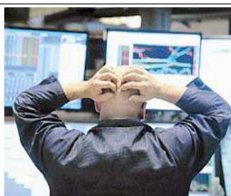
ALLE PAGINE 37, 38 E 39

R2 Quando il mondo sfiora il crac 1929-2009 due crisi allo specchio MAURIZIO RICCI