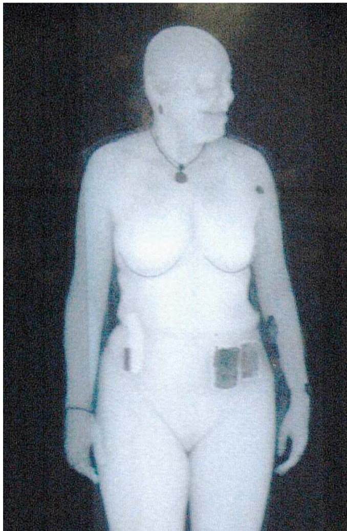
Le immagini di una persona che attraversa il body scanner

SEGUE A PAGINA 11 SERVIZI ALLE PAGINE 10 E 11